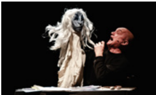
Teatro d'attore, pupazzi e oggetti

La storia della strega Denti di Ferro narra di tre fratelli a cui è stato detto di non avventurarsi nel bosco per evitare l'ira della malvagia strega che vive lì. Un giorno i ragazzi contravvengono il divieto e si perdono mentre cala l'oscurità. In lontananza vedono il lume di una casa, dove li accoglie una vecchina che offre loro riparo. I due fratelli maggiori entrano volentieri, ma il più piccolo segue con riluttanza: sospetta che quella sia davvero la casa della strega e ne sarà certo quando troverà nella casa una grande gabbia e vedrà un muro fatto di tante ossa. Quella notte, mentre i due fratelli maggiori dormono, il più piccolo resiste al sonno e... La storia di Denti di Ferro si inserisce nella tradizione popolare delle storie di magia, di cui ha tutti i tratti caratteristici: la strega che vive isolata nel bosco; i bimbi che, spinti dalla curiosità decidono lo stesso di vedere se esista... È naturale, i bambini hanno bisogno di vivere l'esperienza della scoperta. Una scoperta che, affrontata con intelligenza e furbizia li può far crescere e portare al lieto fine. Oggetti, maschere, figure, pupazzi e musica creano, insieme al loro animatore e narratore, una performance ironica e spassosa, ricca di colpi di scena.