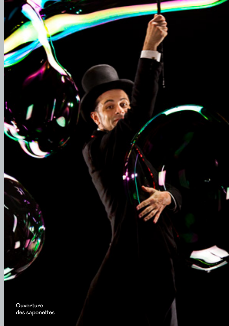
Ouverture des saponettes