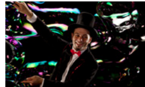
Bolle di sapone

Oh ecco, inizia lo spettacolo... chi è quello col grembiule? Ma va là, dice di essere il direttore! Ma non suonano musica i suoi strumenti! E adesso cosa fa? Diventa un gatto? Guarda, da una tromba è comparsa una rosa! Ehi, qui è umido, piovono grappoli di bolle... Oh no, mi chiama, mi rapisce, dove mi porta? Vedo tutto tondo... sono finito in una bolla di sapone! Un eccentrico direttore d'orchestra vi porterà nel mondo fragile e rotondo delle bolle di sapone per un "concerto" dove l'imprevisto è sempre in agguato: da strani strumenti nascono bolle giganti, bolle rimbalzine, bolle da passeggio, grappoli di bolle... mentre i più paffutelli potranno entrare in una bolla gigantesca! Un racconto visuale senza parole che trae ispirazione dalle atmosfere circensi e del varietà, un magico spettacolo di clownerie, pantomima e musica che, nato per i più piccoli, finisce per incantare il pubblico di qualsiasi età.