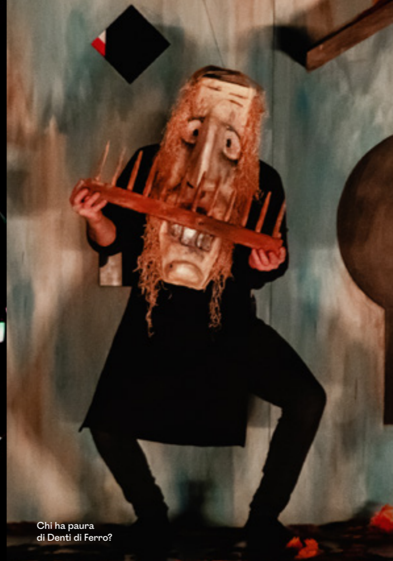
Chi ha paura di Denti di Ferro?